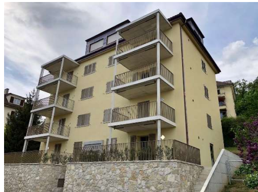
Louis-d'Orléans 13-15 2000 Neuchâtel Immeubles locatifs Construits en 1973 Rénovés en 2024